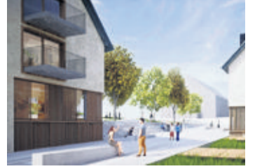
30% des logements seront destinés aux seniors.

La Fondation Prisma dévoile son futur complexe intergénérationnel avec appartements conformes aux besoins des seniors