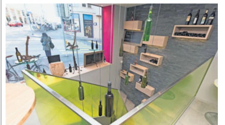
L'escalier du Swiss Wine Hôtel & Bar qui mène au caveau et au fitness.