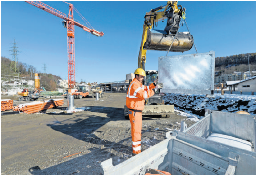
Quelque cent piliers (entourés de tubes alu sur la photo) délimitent le pourtour du nouveau bâtiment. Le squelette de l'ancienne salle de gym est visible au fond. CHANTAL DERVEY

Dès lors, tout a été relativement vite. Hier, on pouvait déjà observer les quelque cent piliers de béton destinés à stabiliser le bâtiment en forme d'étoile pensé par le bureau lausannois Architecture & Retail Rites. En effet, le vaste terrain du Verney doit composer avec son passé de zone marécageuse ( lire