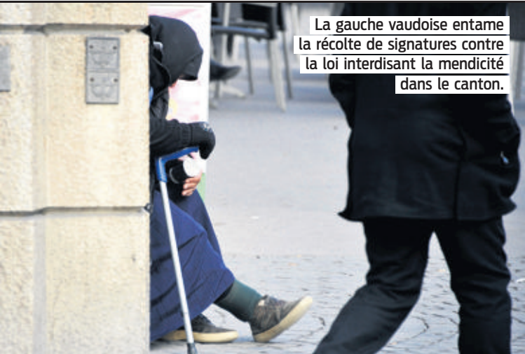
La gauche vaudoise entame la récolte de signatures contre la loi interdisant la mendicité dans le canton.